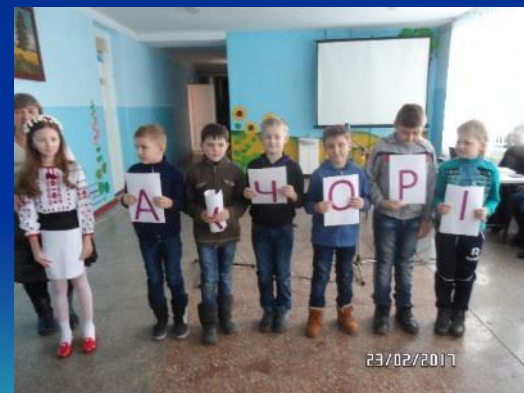
Проведення позакласних заходів