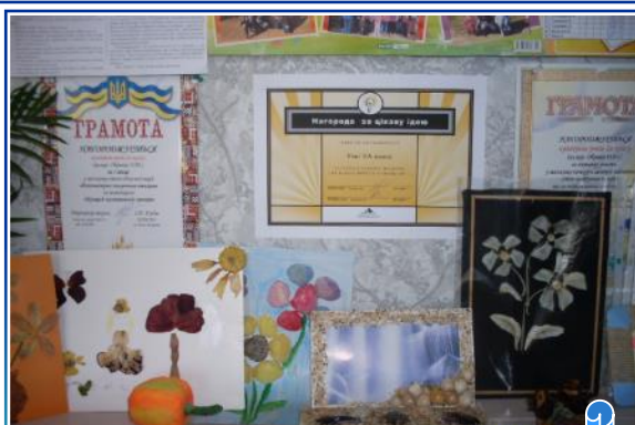
Участь в конкурсах